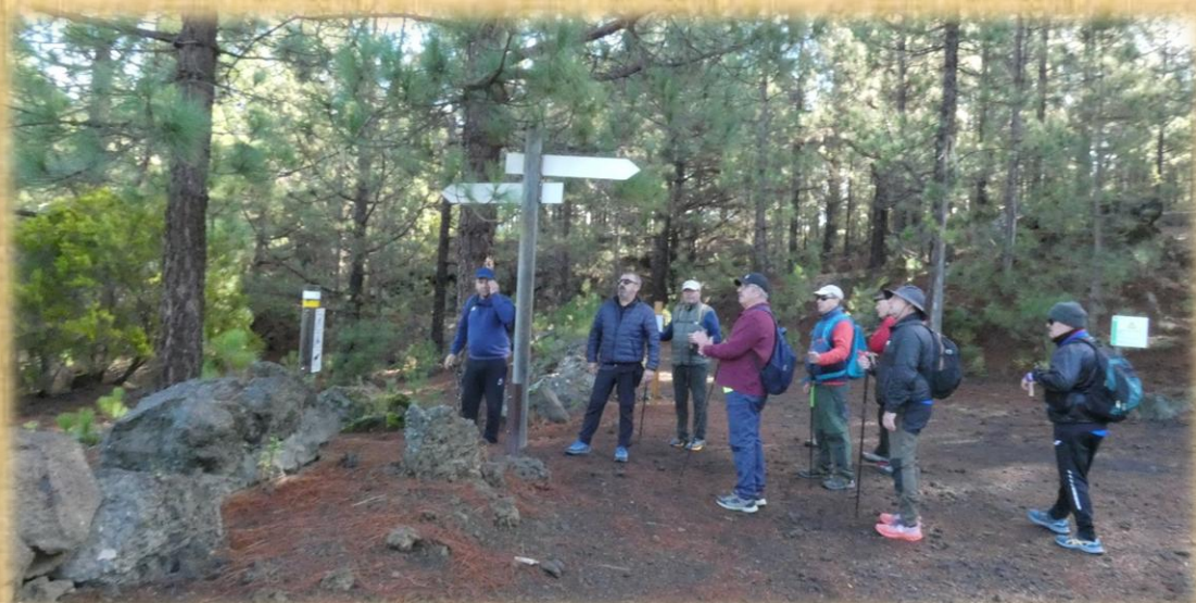
Al llegar a este cruce nos toca descender hasta la zona recreativa.