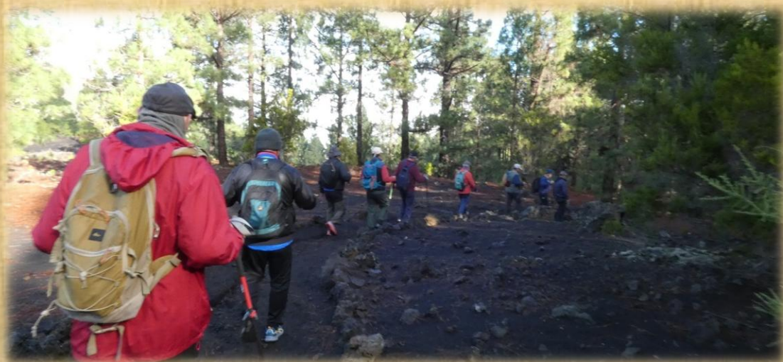
El sendero se encuentra muy bien señalizado y en buenas condiciones para caminar