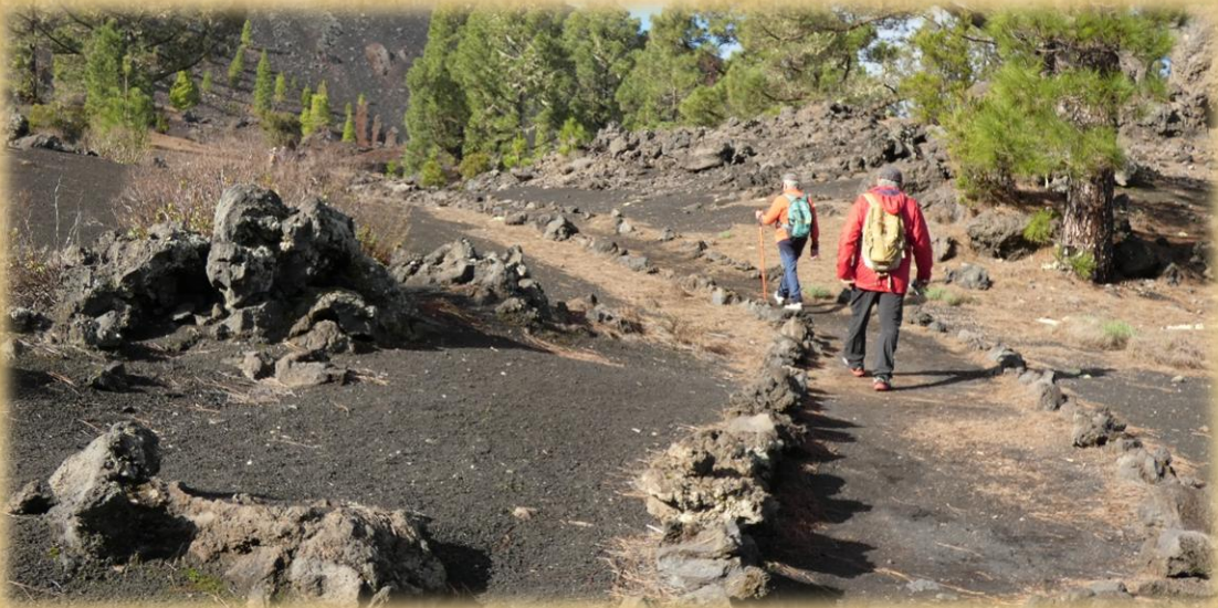
Nos desviamos de la pista y a nuestra derecha tomamos de nuevo el sendero