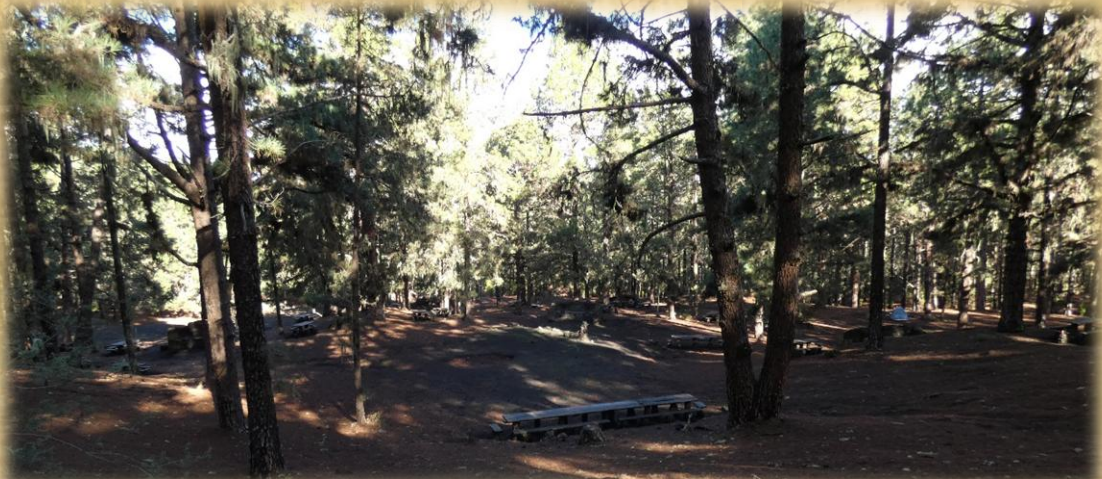
Zona Recreativa de Arenas Negras.