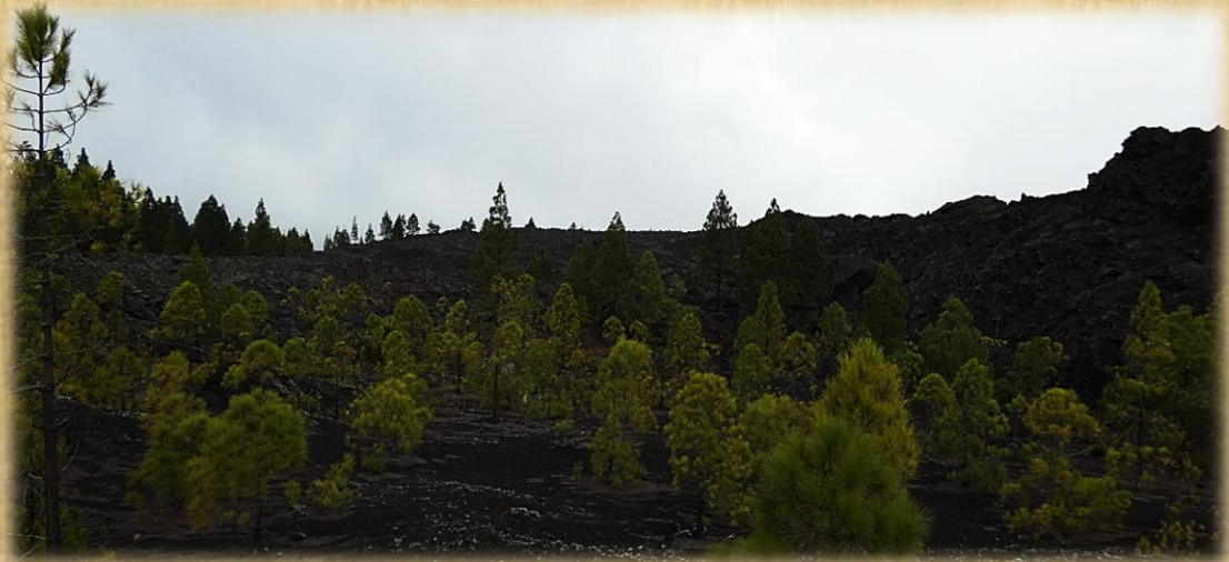
El color del pinar contrasta con el suelo de picón.