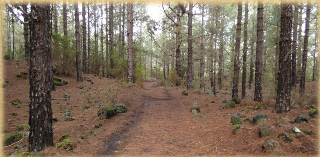
De nuevo nos vamos adentrando en el bosque.