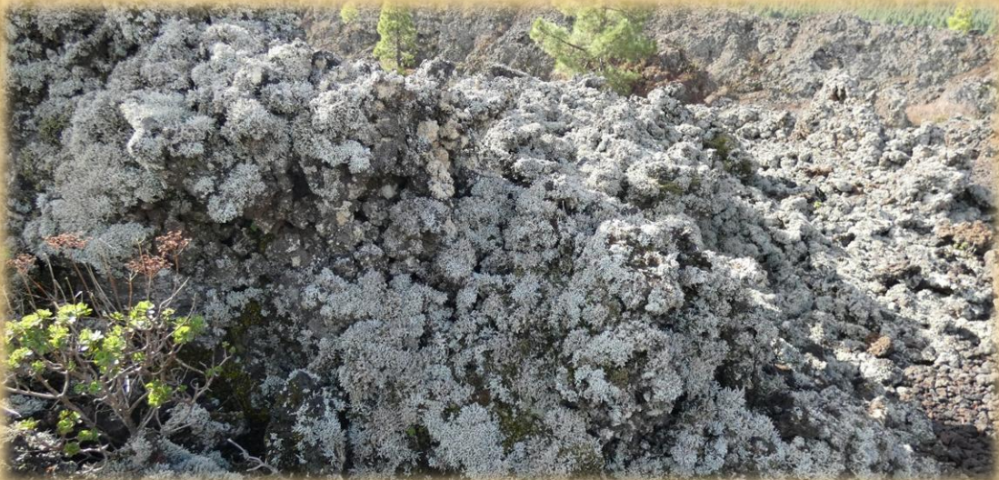
los líquenes van cubriendo la lava de la cara norte.