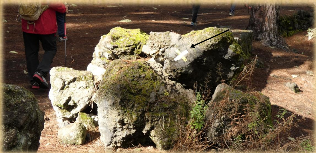
Tomamos la pista que se encuentra en el extremo oeste del parque