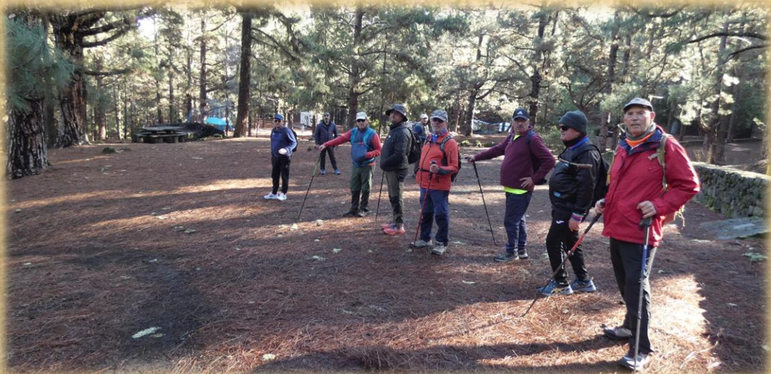
En este lugar también se encuentra una caseta con guardia forestal.