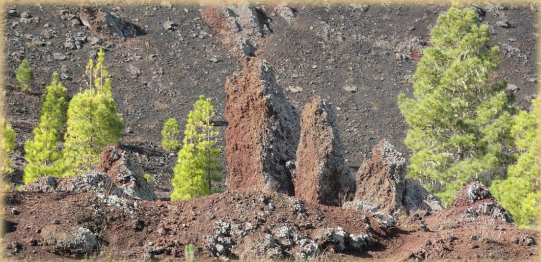
Formaciones rocosas de la erupción.