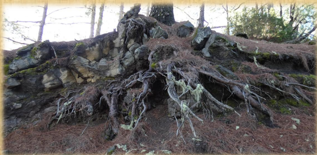
Raíces del pino entre las rocas