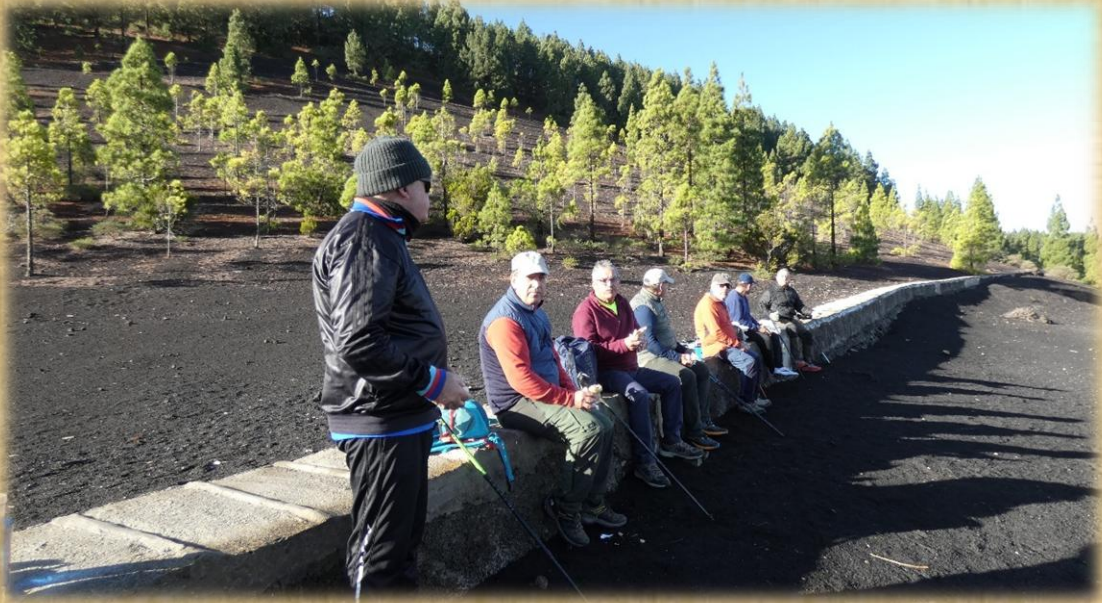
Descanso y desayuno en el canal que lleva el agua de norte a sur de la isla.