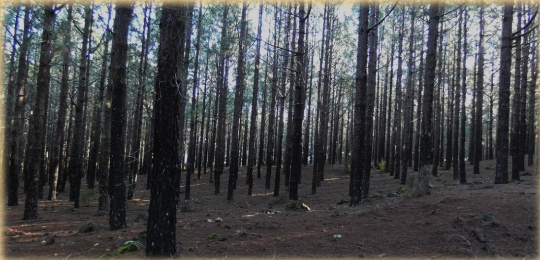
Nos llama la atención las alineaciones del pinar, parecen guardianes del bosque