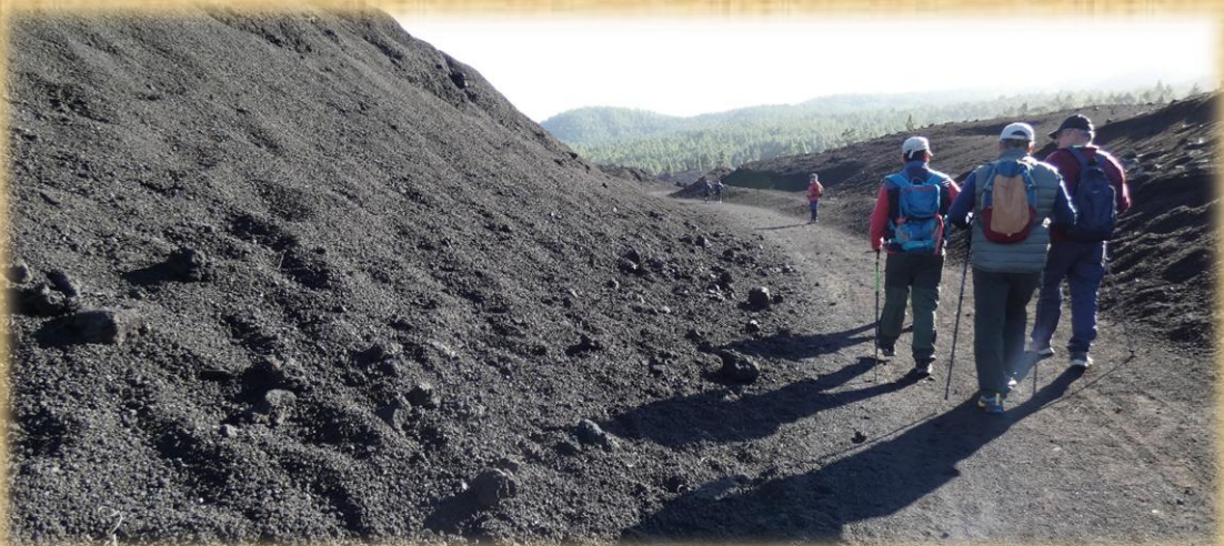
Después del descanso seguimos por la pista en paralelo al canal