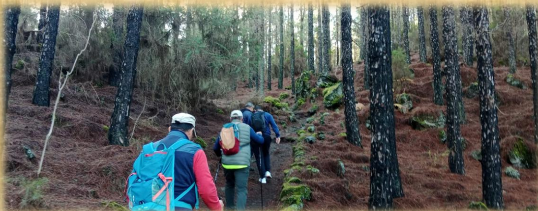
El camino transcurre en este primer tramo en continuo ascenso poco pronunciado