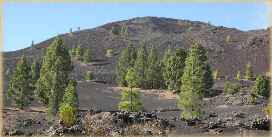
Desde aquí podemos apreciar el cráter del volcán.