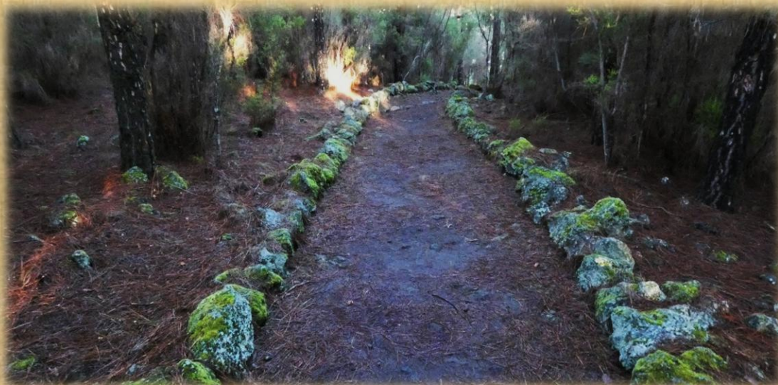
El sendero se encuentra en magníficas condiciones