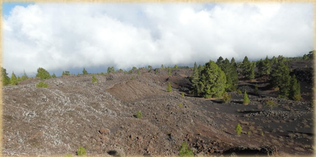
Las nubes van ascendiendo y van cubriendo la zona.