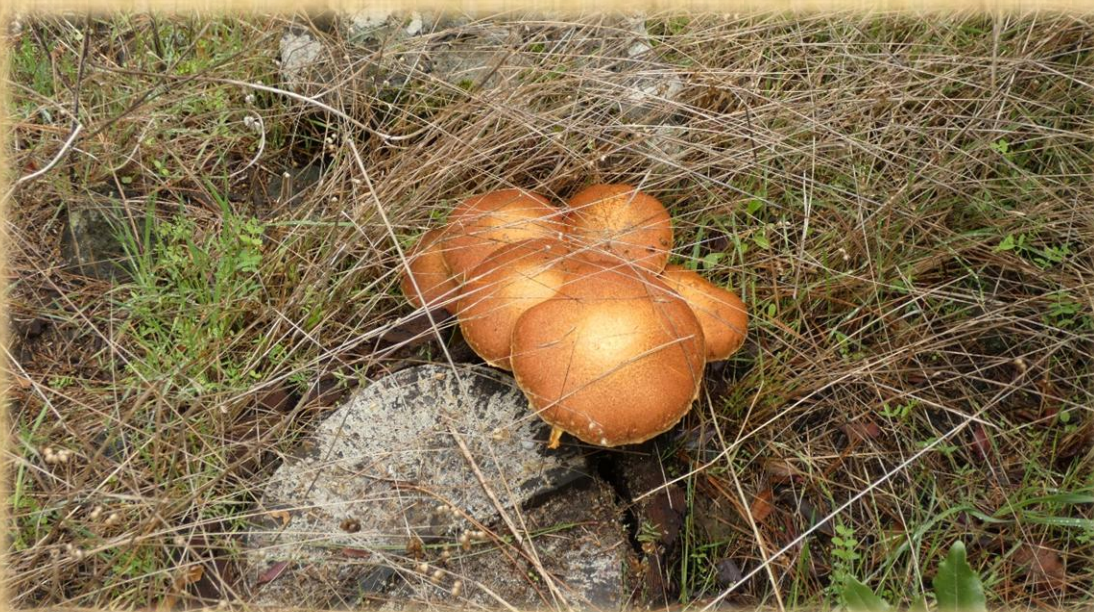
Debido a la humedad emergen gran cantidad de setas.