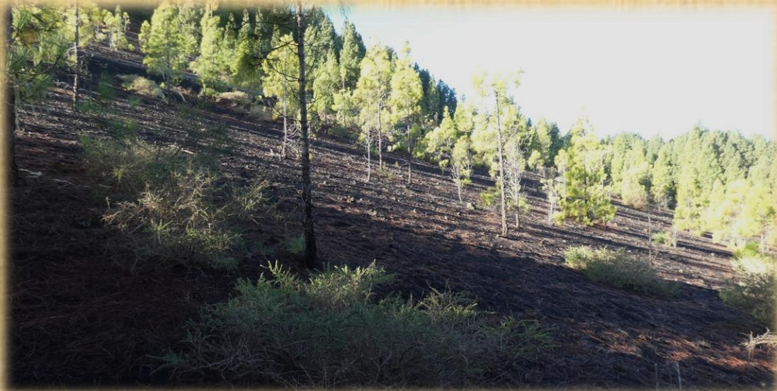
Mientras ascendemos nos vamos adentrando en zona de cenizas volcánicas