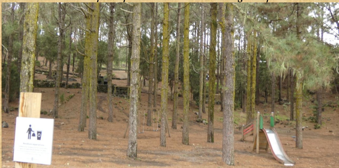
Zona Recreativa del San José de los Llanos.