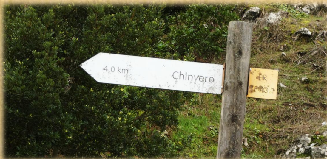
Al llegar a esta señal nos adentramos en el bosque.