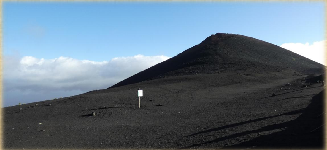
El volcán de Trevejos conocido también por Arenas Negras o de Garachico.