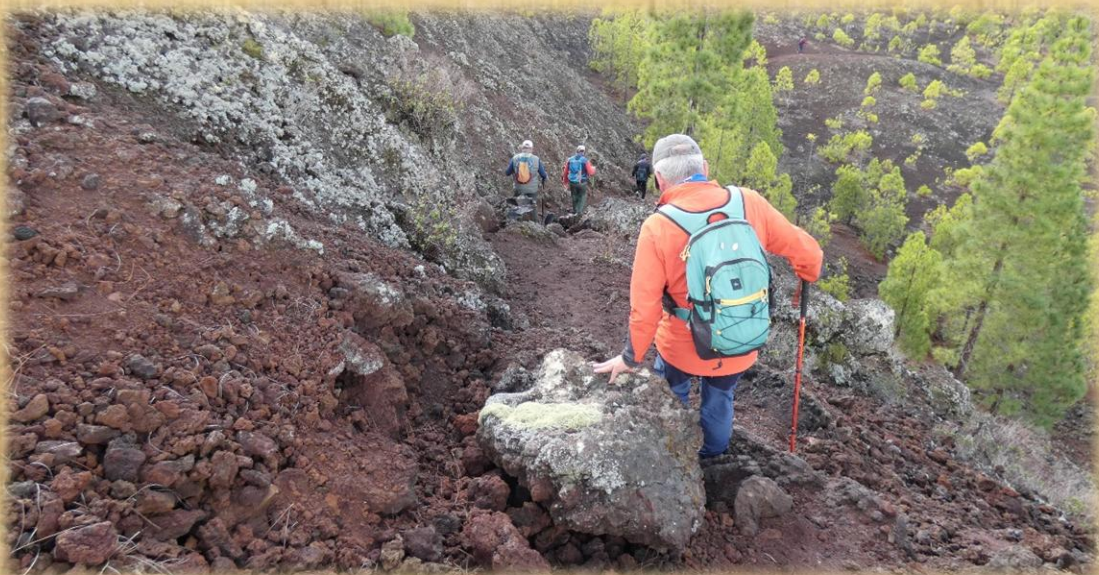
Hay que tener precaución en esta zona de lava debido al suelo irregular.