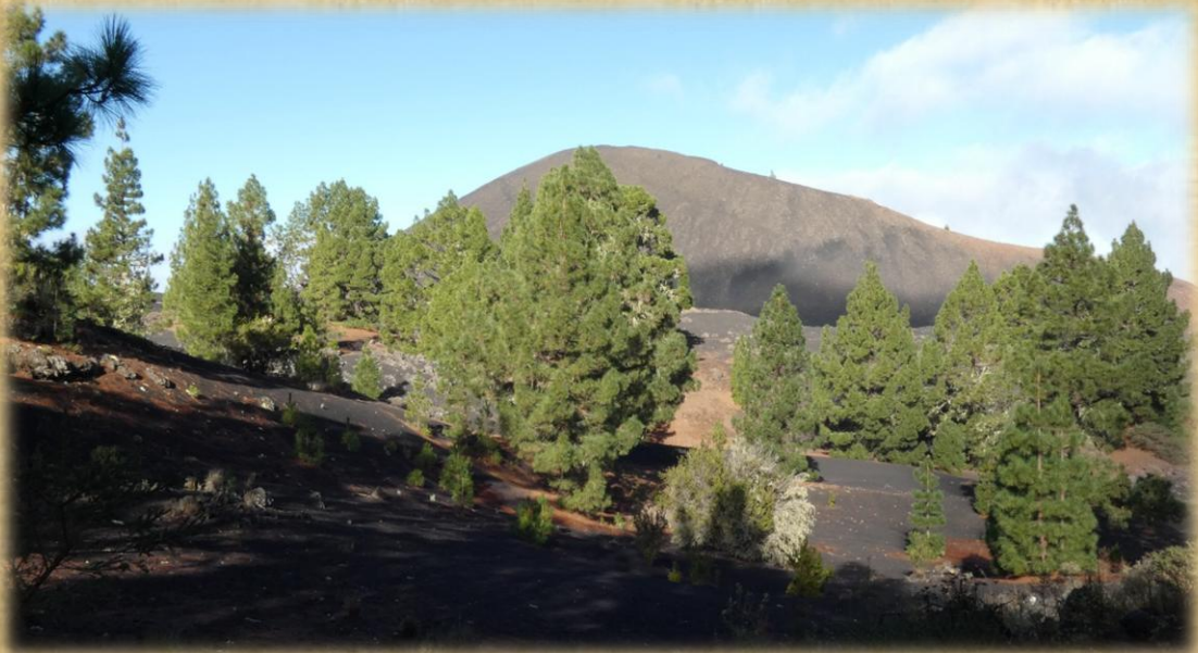
Bordeando el volcán