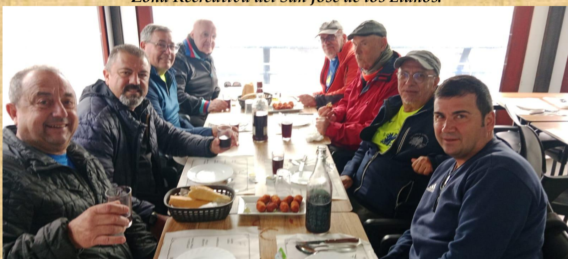
Decidimos almorzar en el guachinche que se encuentra en el mismo parque recreativo.