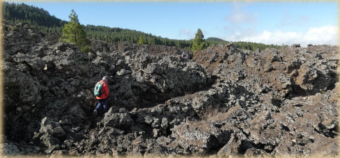
Pasamos por una de las lenguas de lava del volcán.