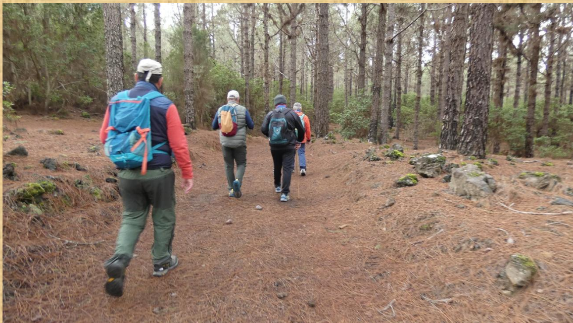
Tomamos la pista que nos lleva de nuevo al lugar de partida.