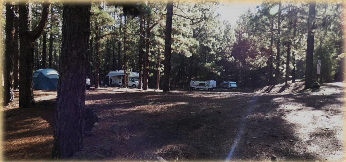
Numerosas caravanas acamparon la noche anterior en la zona recreativa