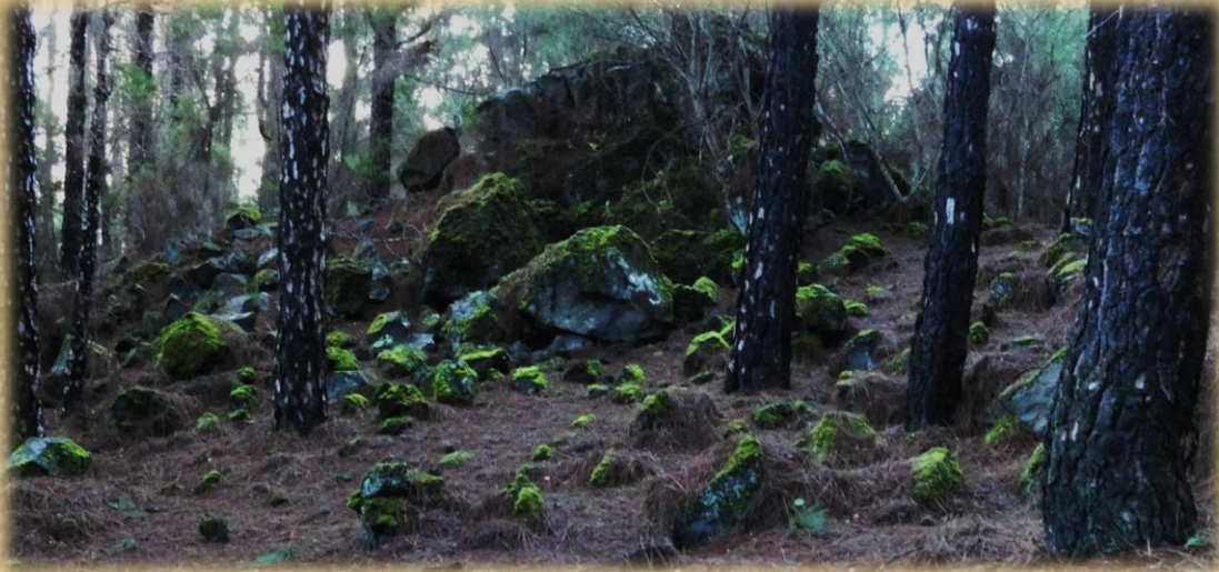
El verdor de las rocas nos indica la humedad de la zona