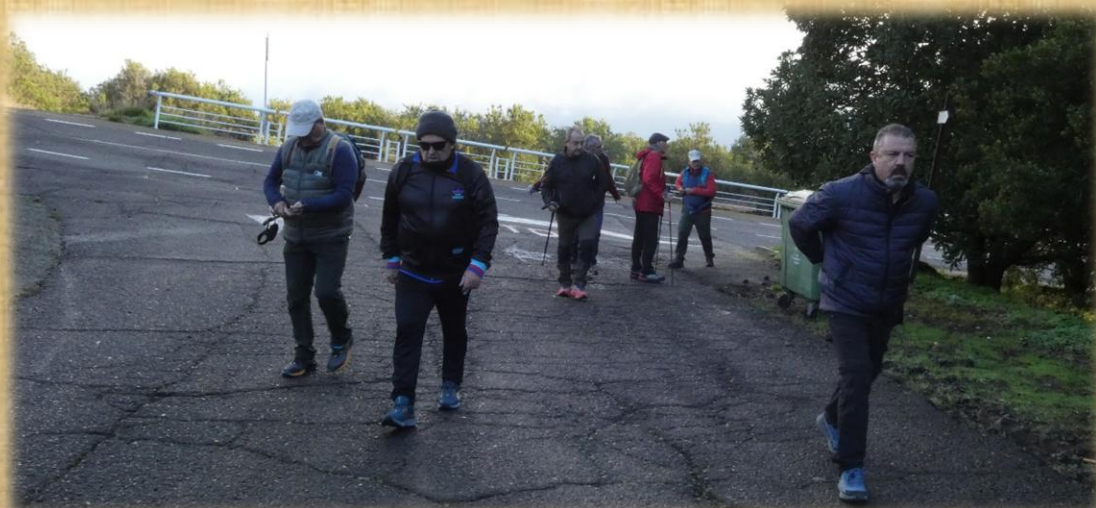
Desde la zona recreativa al llegar al primer cruce comenzamos a subir.